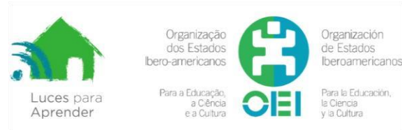
Figura N°1 Diseño para grabar en dispositivos