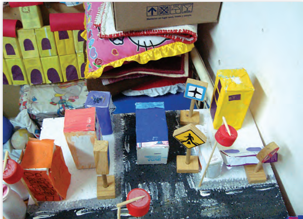
Jardín de Infantes El Principito, Clorinda, Formosa.