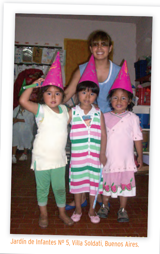
Jardín de Infantes Nº 5, Villa Soldati, Buenos Aires.