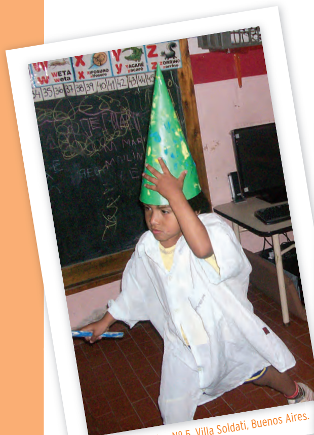
Jardín de Infantes Nº 5, Villa Soldati, Buenos Aires.

Para potenciar al máximo la propuesta es interesante incluir en el momento de Juego-trabajo los materiales utilizados. Así, en el rincón de dramatizaciones podrán seguir jugando a hadas y brujos; en el de literatura tendrán a disposición los cuentos y poesías que se van utilizando, etc.