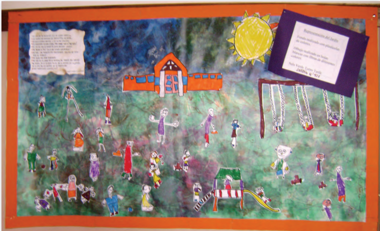
Jardín de Infantes N°5 El Principito, Clorinda, Formosa.

Todo lo que pueda quedar como registro de las situaciones vivenciadas a lo largo del Proyecto hace posible la comunicación con otros y la propia visualización del recorrido por parte de los niños. Hacer visible la propuesta a los protagonistas y a la comunidad permite tomar dimensión real de los aprendizajes y las experiencias de los niños.