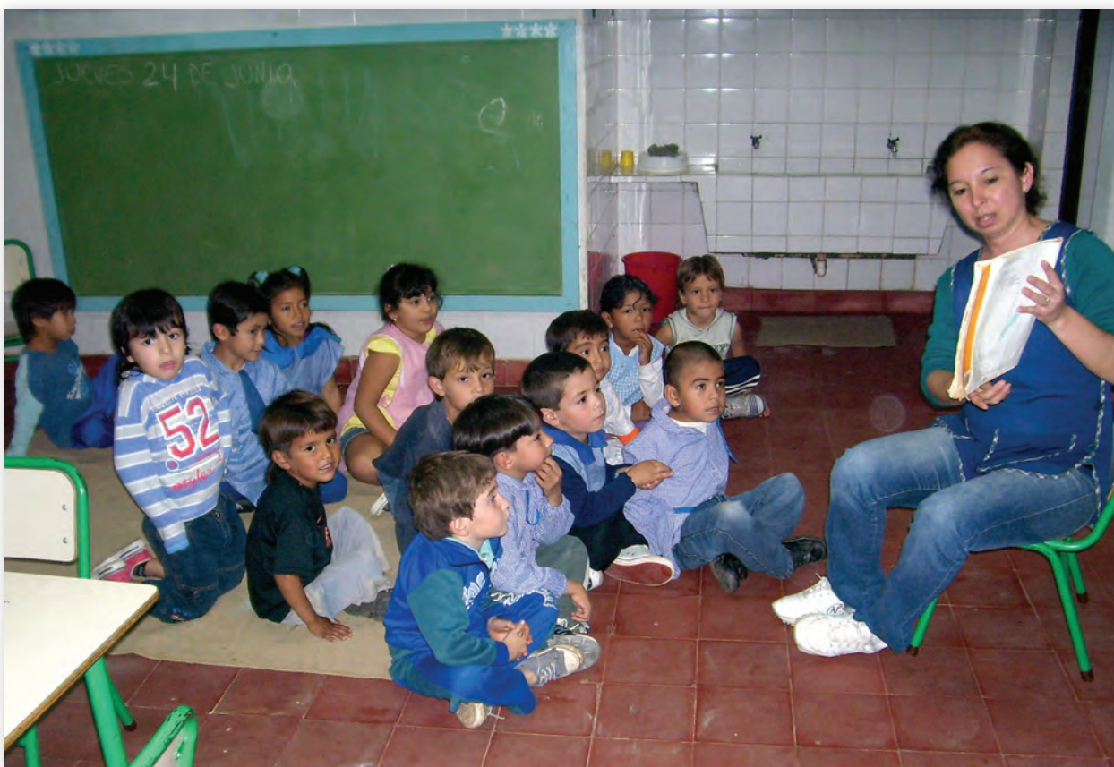
Jardín de Fontana, Chaco.

Es importante que podamos leer varios cuentos de hadas y brujos. La variedad de relatos les permitirá disponer de un mayor repertorio de rasgos de estos personajes a la hora de jugar con ellos.