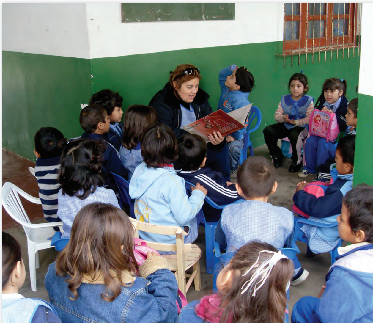
Jardín de Infantes Nº 18, Clorinda, Formosa.

Para retomar la vez siguiente, antes de seguir con la lectura, se pueden plantear algunas preguntas: ¿en qué quedamos con la historia?, ¿qué había pasado? Expliquémosle a un compañero/a que no estuvo ese día qué pasó para que siga la historia.