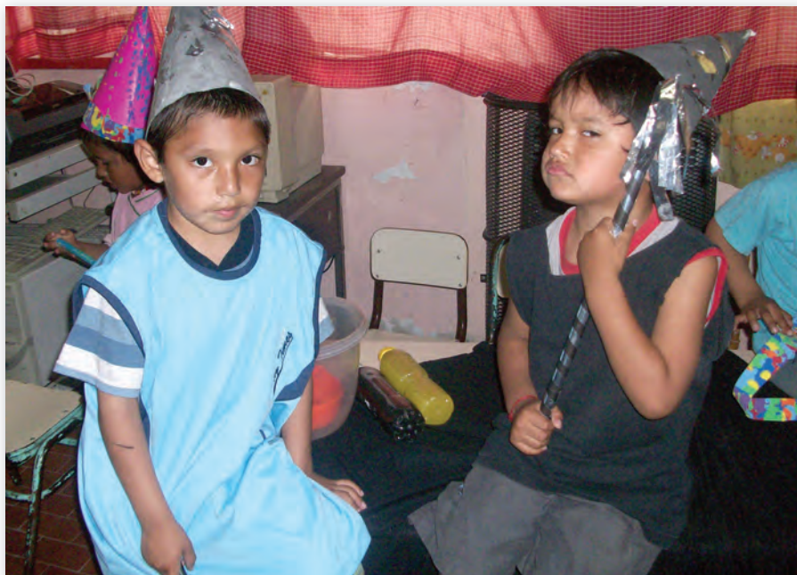
Jardín de Infantes Nº 5, Villa Soldati, Buenos Aires.

Si las hadas no volaran, nadarían con las alas como peces de aire claro con burbujas de palabras.