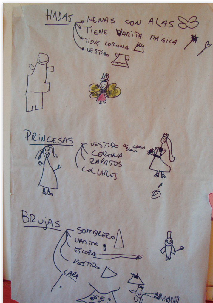
Cartelera donde figuran las impresiones sobre brujas, hadas y princesas.

Armaron un cuadro con atributos de las brujas y las hadas.