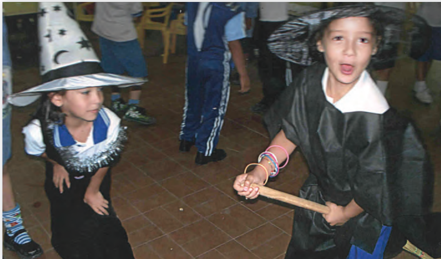
Jardín de Infantes Nº 5 El Principito, Clorinda, Formosa.

Uno de los juegos más frecuentes en los niños entre 18 meses y 5 años, es el juego simbólico. Desde muy pequeños, los niños nos sorprenden transformando acciones cotidianas en “como si” y la sonrisa o el brillo de la mirada nos indican que ellos y nosotros “sabemos” que, aunque la escena sea muy semejante a lo real, es un juego. Así es diferente “dormir” a “hacer que duermo”, “saludar” que asomarme por el respaldo de la silla y hacer como si “estoy pero no estoy, aparezco pero me oculto”, etc.