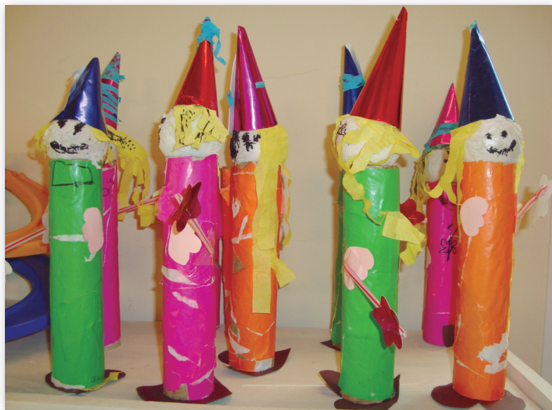
Sala de 5 años. Muñecos de brujas.

En ocasión de visita a la escuela y de observación en la clase Andrea, la maestra de sala 5 años, nos cuenta que está trabajando con brujos/as. Dibujaron, hicieron disfraces y hoy van a caracterizarse y pintarse con maquillaje. Alejandra, la maestra de sala de 4 años, está contando cuentos y también armaron disfraces. En cada sala, el juego se inicia a partir del disfraz y, de a poco, comienzan a aparecer diferentes acciones: mezclar pociones, decir conjuros con las varitas, observarse en el espejo del baño y hacer muecas recitando fórmulas mágicas. El juego resulta por momentos individual o a lo sumo en pareja, los niños requerirán jugar repetidas veces para que se construya un argumento consistente que permita sostener una trama dramática.