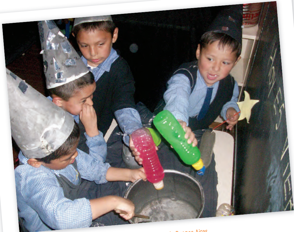
Escuela Infantil N°5 D.E. 19, Villa Soldati, Ciudad Autónoma de Buenos Aires.

La propuesta será entonces cocinar con los niños algo para compartir con las familias o los niños de otras salas que hayan sido invitados al encuentro. Se podrían preparar galletitas con alguna forma: sombrero de bruja y estrella mágica, cara de gato, unas con grana negra (de brujas) y otras rosadas (de hadas).