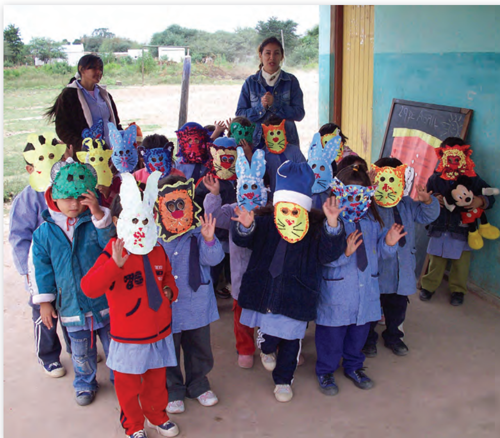
Jardín de Infantes de la Escuela N° 484, Ingeniero Juárez, Formosa.