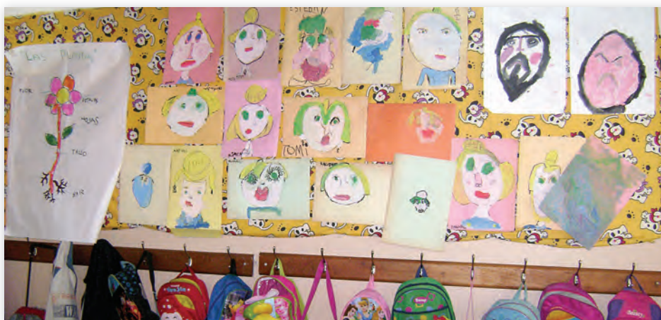
Jardín de Infantes Nº 921, Tigre, Buenos Aires.

El Proyecto que se presenta está pensado para desarrollarse entre 6 y 8 semanas dedicándole un mínimo de tres actividades semanales.