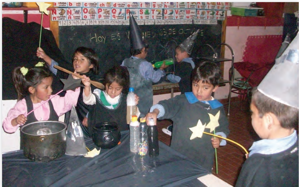
Escuela Infantil Nº 5. D.E. 19, Villa Soldati, Ciudad Autónoma de Buenos Aires. 2009.