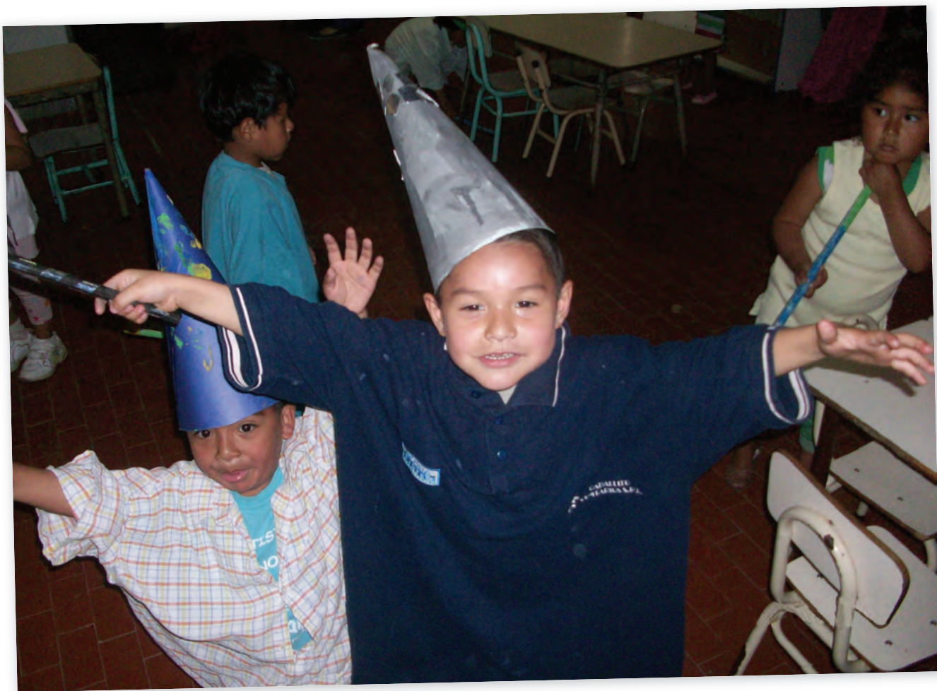
Escuela Infantil Nº5 D.E. 19, Villa Soldati, Ciudad Autónoma de Buenos Aires.

El desafío es que la tarea propuesta resulte rica, sostenida y movilizadora. Y esto sólo se logra cuando los niños y los maestros sienten y creen que vale la pena enseñar y aprender de esta manera.