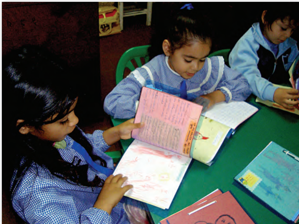
Libros realizados por niños del Jardín de Infantes N°5 El Principito, Clorinda, Formosa.

Cierre: Se vuelve sobre las imágenes y, si es posible, se inicia el armado del libro. A veces, el maestro tiene mucha tarea para concretar el armado y no puede terminarlo en el momento. Si ésa es la situación, lo volverá a leer cuando esté terminado junto con los niños.