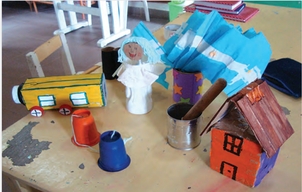
Jardín de Infantes Capullito de algodón, Clorinda, Formosa.