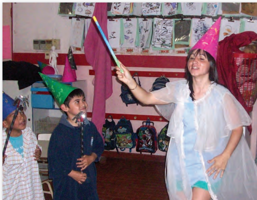
Jardín de Infantes Nº 5, Villa Soldati, Buenos Aires.

En este primer juego, es probable que los niños sólo exploren los elementos y no hagan otra cosa más que circular disfrazados con la varita o con la escoba, apenas ensayando algún tipo de interacción dramática. También es importante estar atento a lo que sucede para decidir en qué momento finalizar la propuesta de juego dramático.