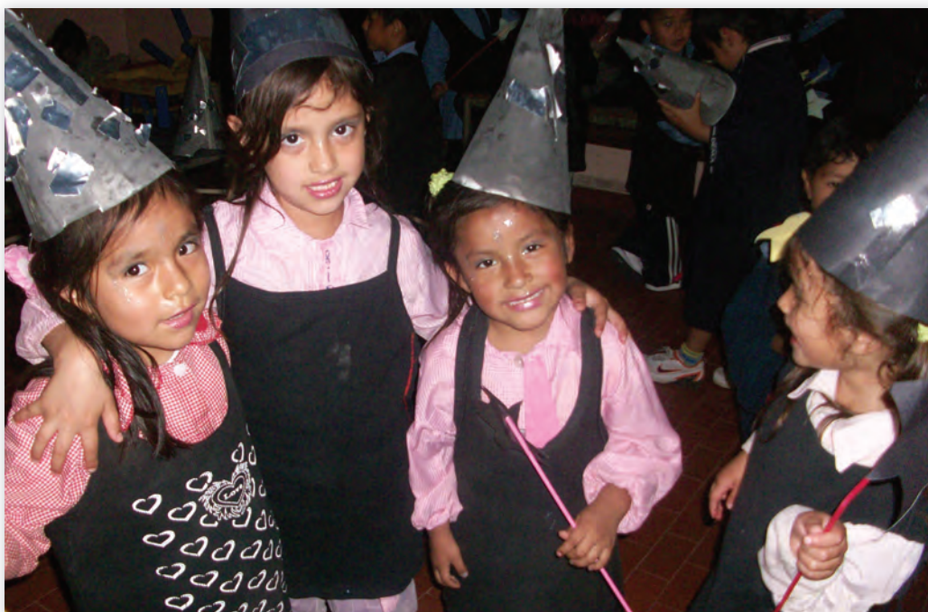
Escuela Infantil Nº 5 D.E. 19, Villa Soldati, Ciudad Autónoma de Buenos Aires.

Es interesante instalar un clima de cierre y despedida del Proyecto: se pueden tomar fotos, poner música acorde, conversar acerca de lo que han compartido en este período de trabajo y planear en forma conjunta el cierre general del Proyecto.