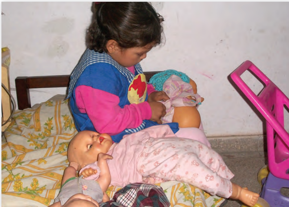
Jardín de Infantes Nº 66, Fontana, Chaco.

En este Cuaderno el tema seleccionado es Hadas, duendes y brujos y el tipo de texto que se privilegia como fuente de información es el literario. Este Proyecto se inicia con la lectura de cuentos maravillosos, leyendas o poesías, en los que los protagonistas permitan imaginar otros mundos posibles, crear ambientes diversos y dejar volar la imaginación tomando como punto de encuentro las múltiples posibilidades que ofrece el juego simbólico.