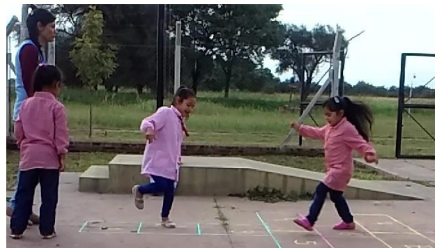
Juegan juntos. Recorren detrás del compañero, dan indicaciones desde fuera del juego.