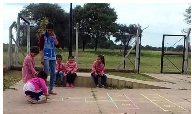
Dan indicaciones, muestran, acompañan.