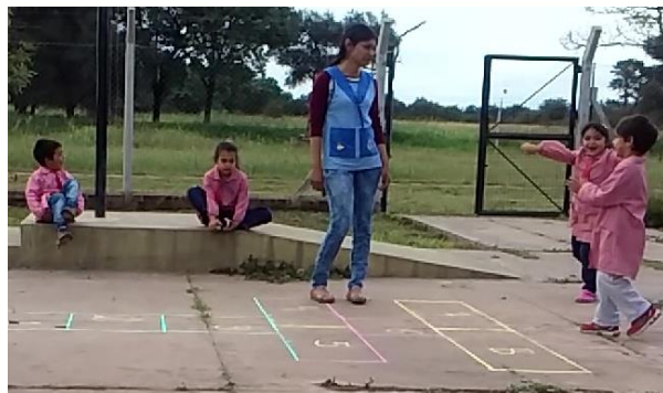
Muestran el camino, dialogan con la maestra, dan indicaciones.