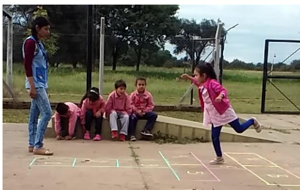
Observan el juego del compañero.

La maestra da indicaciones diferentes según los chicos dominen el salto en un pie o no.