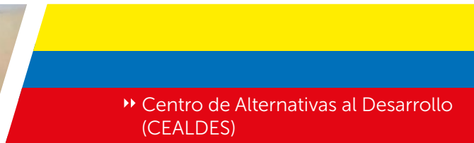
▶ Centro de Alternativas al Desarrollo (CEALDES)

El proyecto busca formar a estudiantes, padres y maestros en mecanismos de mediación, apoyados por el departamento de psicorientación, para la convivencia y la resolución pacífica de conflictos. De esta forma, se logra canalizar las relaciones interpersonales hacia el crecimiento humano, el desarrollo psicoafectivo y de las habilidades sociales.