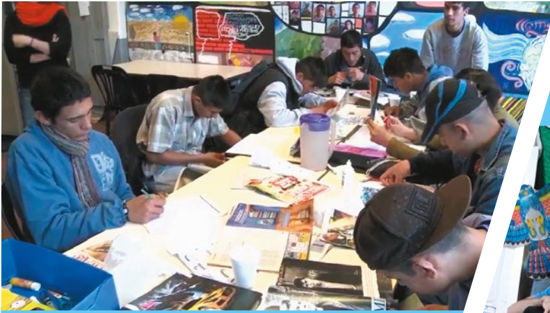
▶ Centro Educativo Isauro Arancibia