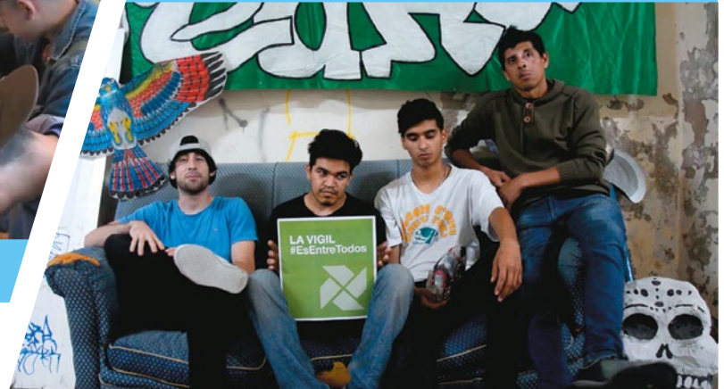
▶ Biblioteca Popular C.C. Vigil

El Centro Educativo Isauro Arancibia (CEIA) es una Escuela Primaria Pública para Adolescentes, Jóvenes y Adultos que genera propuestas para orientar a los estudiantes fortaleciendo sus trayectorias escolares y mejorando sus capacidades de integración social. Proyecto de vida, es un dispositivo que tiene como fin acompañar al estudiante en su camino de la educación primaria a la media, realizando diferentes actividades donde los jóvenes pueden comenzar a imaginar su futuro y buscar instituciones que le ayuden a consolidarlo.