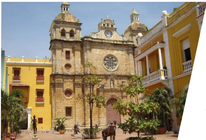
» Santuario de San Pedro Claver