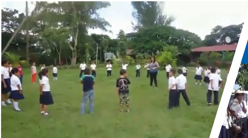
▶ Centro Educativo Miguel Paz Barahona