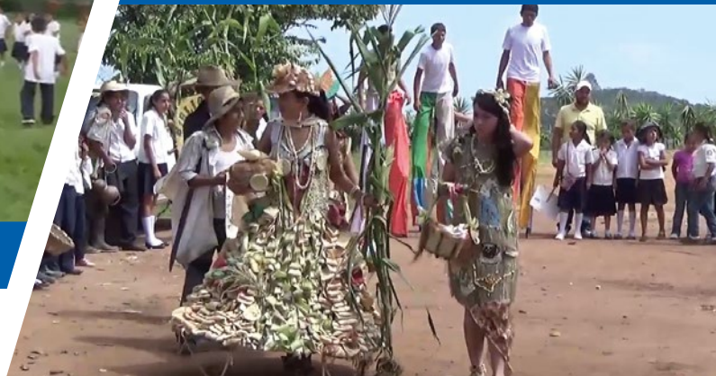
▶ Centro Cultural Hibuera

El proyecto es una escuela piloto enfocada en orientar a los niños en la producción agrícola además de un proceso de formación integral. Se fundamenta en que además de dotar a los niños y niñas de las técnicas para la producción agrícola, se desarrolla una educación en valores tales como: el Derecho a la educación, la igualdad de género, la prevención a los abusos sexuales, la higiene y el saneamiento, derechos sexuales y reproductivos, la prevención de la violencia, el bullying, el emprendedurismo social y financiero del conjunto de la comunidad educativas (padres y madres, alumnado y profesorado).