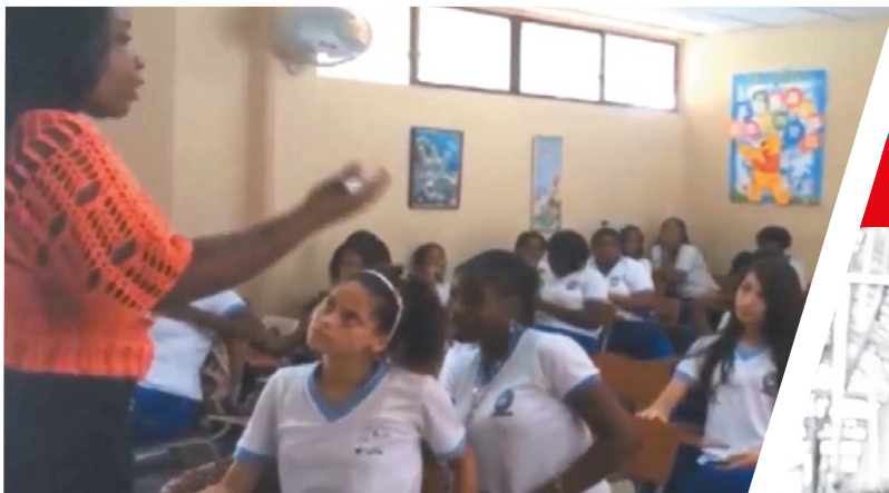
▶ Escuela Normal Superior Juan Ladrilleros