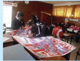
Estudiantes concluyendo sus trabajos para la exposición final

YouTube: Buscar "Perú: Memorias colmadas de Amor"