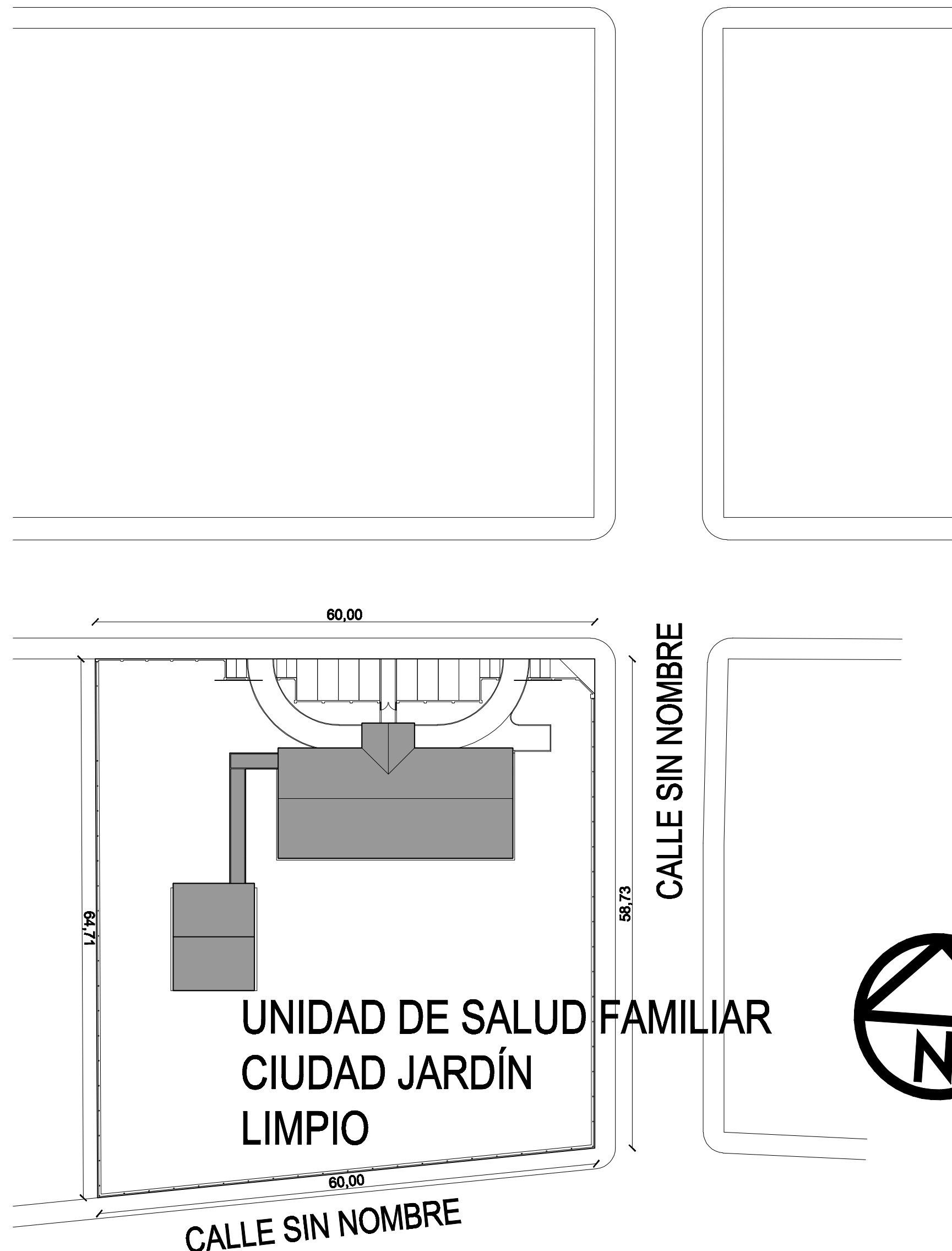
PLANTA DE UBICACIÓN ESCALA 1:500