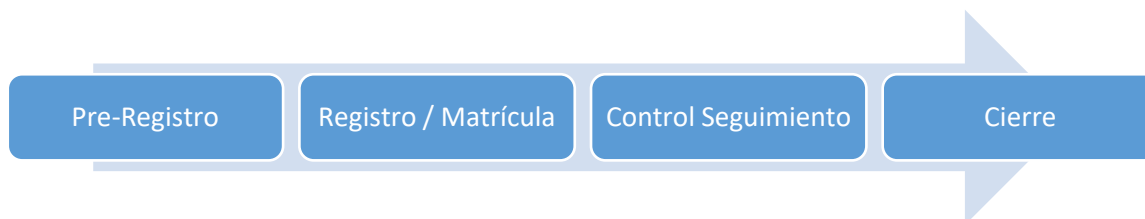
Dibujo 1: Proceso de gestión académica

La Gestión Académica, debe iniciar con un proceso de pre-registro y/o pre-matrícula de los usuarios, seguido de un aseguramiento de aprobación del cupo asignado o registro de matrícula, seguimiento y cierre. Adicionalmente, se debe realizar la personalización de las temáticas o currículo del curso, así como el registro de maestros, estudiantes y cursos.