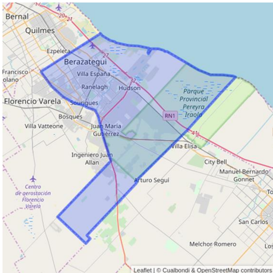
Ilustración 1- Partido de Berazategui

El partido de Berazategui forma parte de la provincia de Buenos Aires, a 23 km al sudeste de la ciudad de Buenos Aires. Sus límites son: al norte el partido de Quilmes, al este el Río de La Plata, al oeste el partido de Florencio Varela y al sureste con los partidos de La Plata y Ensenada. Está compuesto por nueve localidades: Berazategui, Hudson, Ranelagh, Plátanos, Villa España, Gutiérrez, Sourigues, El Pato y Pereyra.