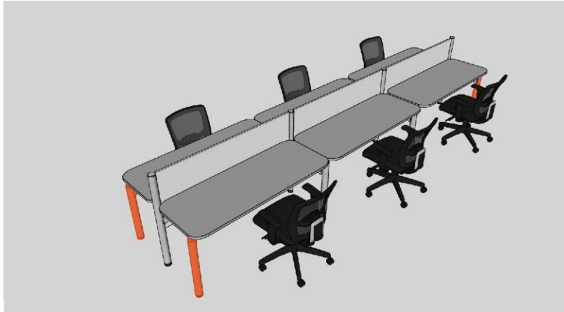
PASO 2: REEMPLAZO PATAS (Gráfico Ilustrativo).