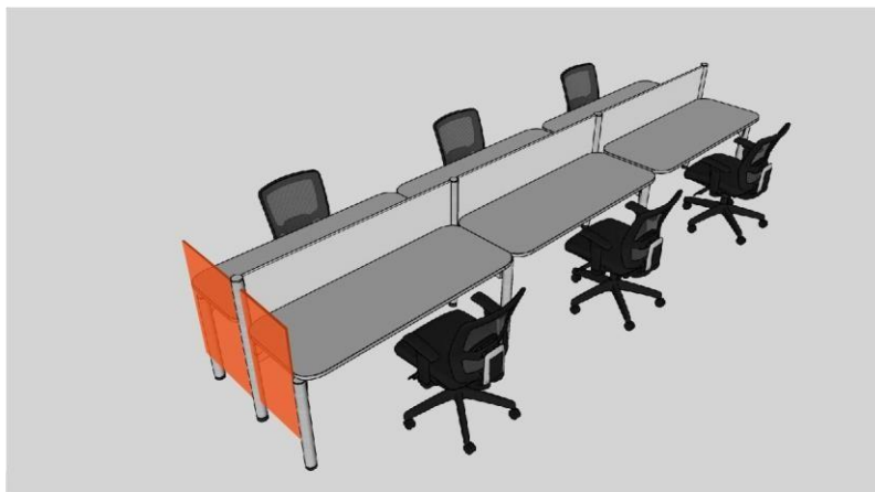
PASO 1: RETIRO LATERALES (Grafico ilustrativo).

PASO 1: Retiro de panelería existente lateral entelada naranja para mobiliario de puestos de trabajo.