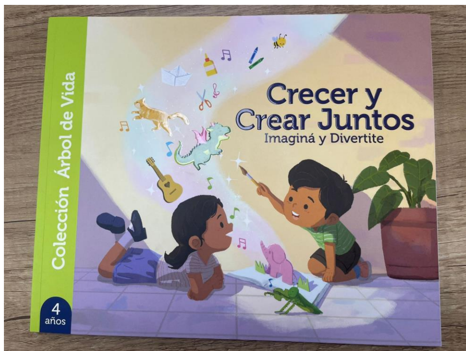
Imagen de referencia del acabado: